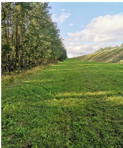
Между трассой и лесом можно передвигаться на велосипеде