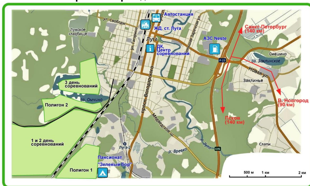
Схема районов проведения Чемпионата России

Районы закрыты для посещения спортсменами, тренерами, представителями команд до окончания Чемпионата России.