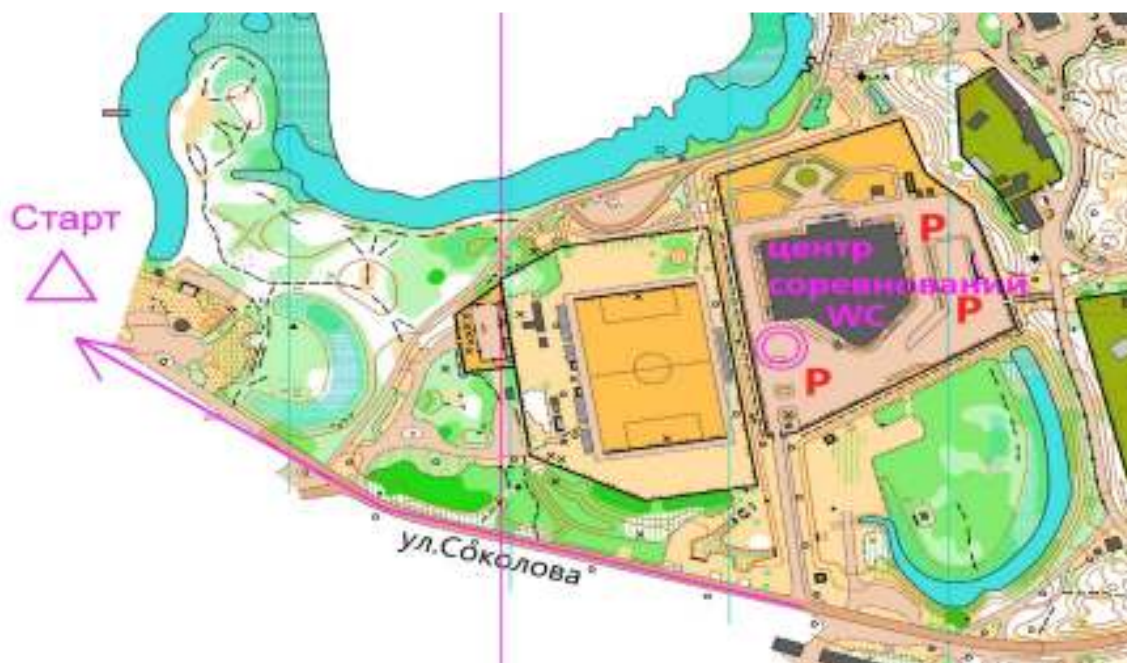
Схема центра соревнований

Снежный покров присутствует незначительно