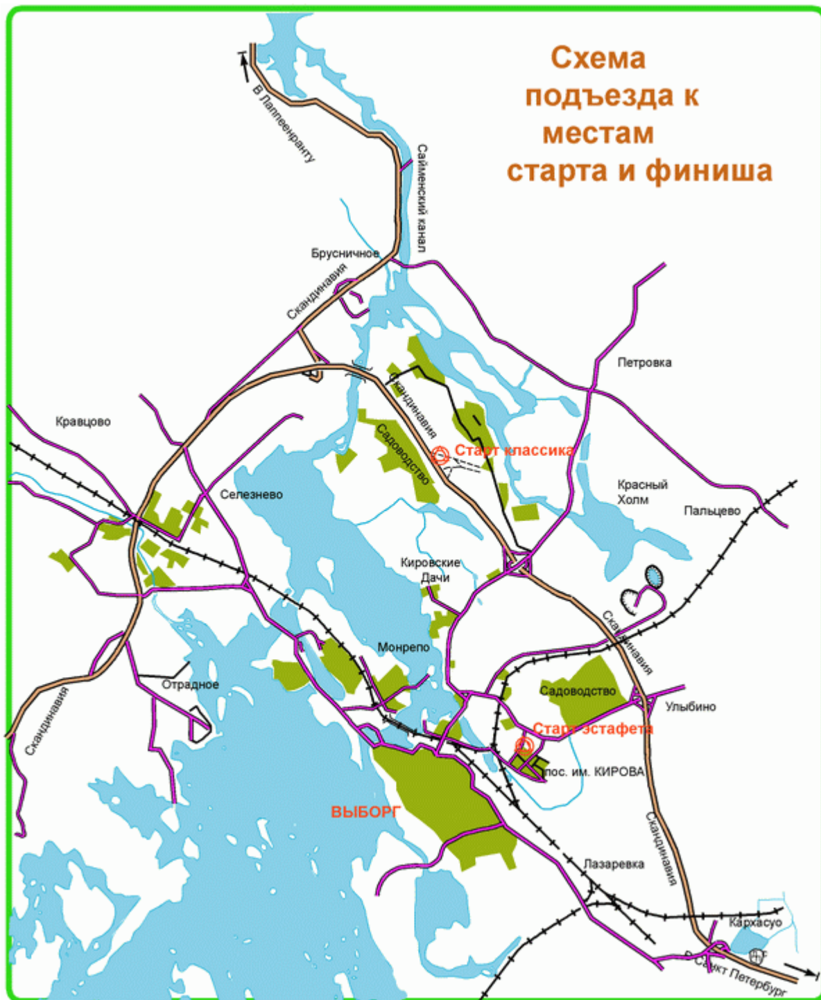
СХЕМА ПРОЕЗДА К МЕСТУ СТАРТА

Команды и победители в группах, а также призеры в эстафетах, награждаются памятными медалями и дипломами.