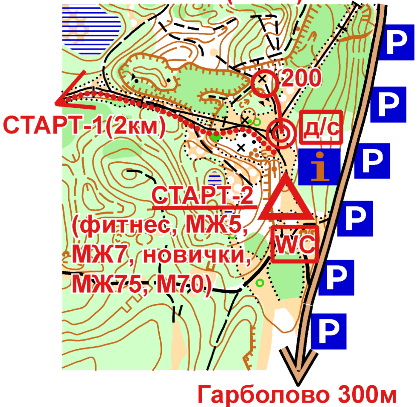
Схема центра соревнований 14.05.17(12.00)